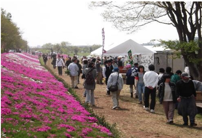
水と緑の広場 芝桜の様子